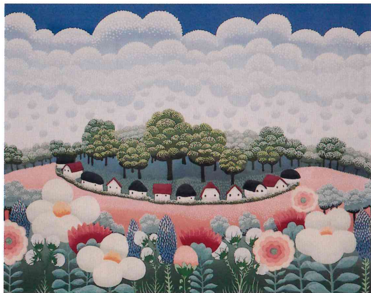
『花咲く村』 イワン・ラブジン