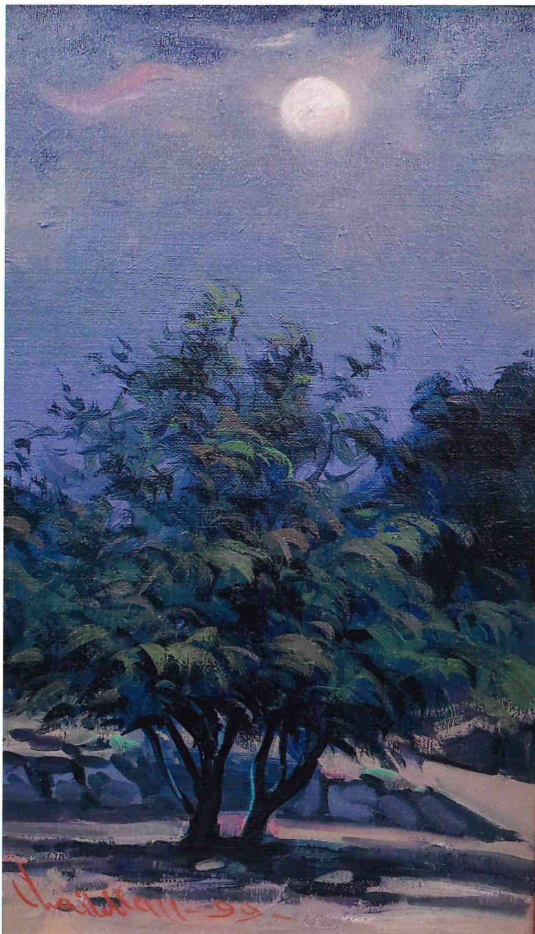
『月光のソナタ』 車一萬